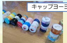
キャップヨーヨー