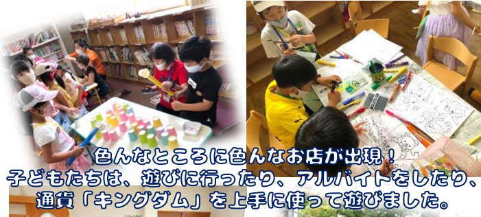
色んなところに色んなお店が出現！ 子どもたちは、遊びに行ったり、アルバイトをしたり、通貨「キングダム」を上手に使って遊びました。