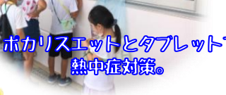
ホカリスエットとタブレットで熱中症対策。

夕方からは、希望者が参加するきもだめし… だんだんと口数が減り、 大号泣のお友だちも… 子ども達にとっては、武勇伝！