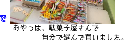
おやつは、駄菓子屋さんで自分で選んで買いました。