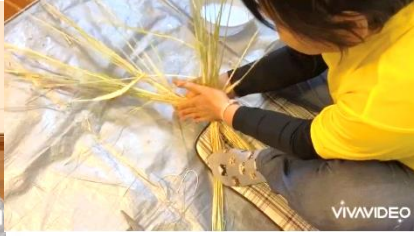
前からの動画と、手元の動画を見ながら、皆さん悪戦苦闘しながら、取り組まれたそうです。