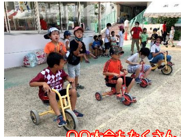
〇〇大会もたくさん！優勝すると黄金ゲット！