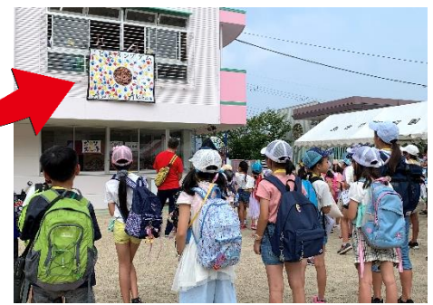
「こどもキングダム」国旗掲揚。 こどものための、こどもによる、1日限りの王国の誕生！