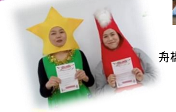
↑サンタとあそぼう！ 舟橋ポストナカイも登場しました。