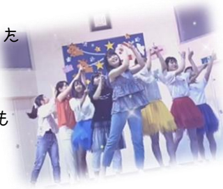
あまひのひちひちアイドルも子ども達に大人気でした！