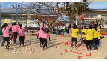
あまひスポーツフェスティバル スポーツの結果がクイズになっていました